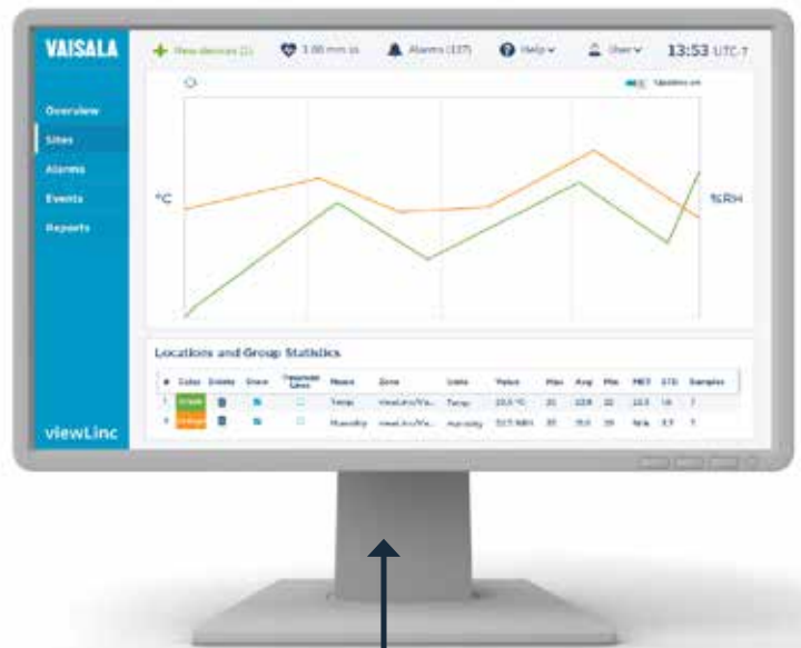
Vergleichendes Analysediagramm aktueller und vergangener Bedingungen

In Rundgängen wird die Verwendung der Software gezeigt: Einrichten von viewLinc, Erstellen einer Zone, Erstellen eines Standortes, Hinzufügen eines Benutzenden und vieles mehr