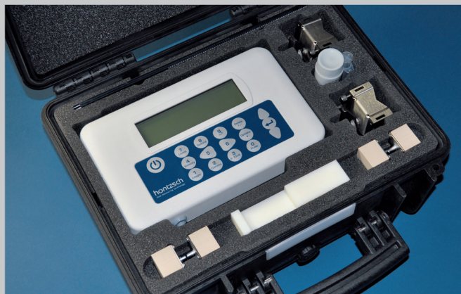
Lieferumfang mit IP67-Transportkoffer